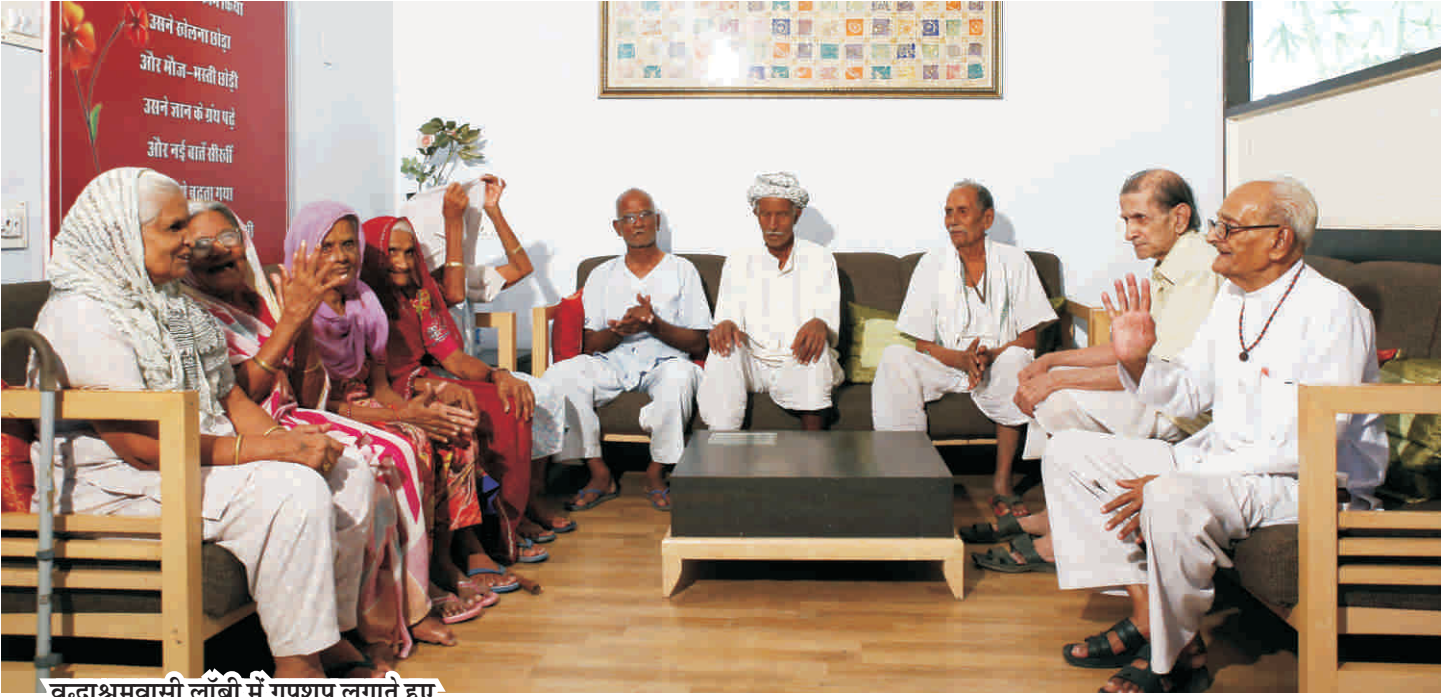
वृद्धाश्रमवासी लॉबी में गपशप लगाते हुए