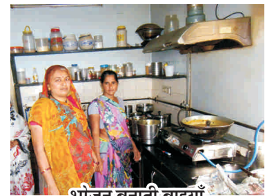
भोजन बनाती बाइयाँ