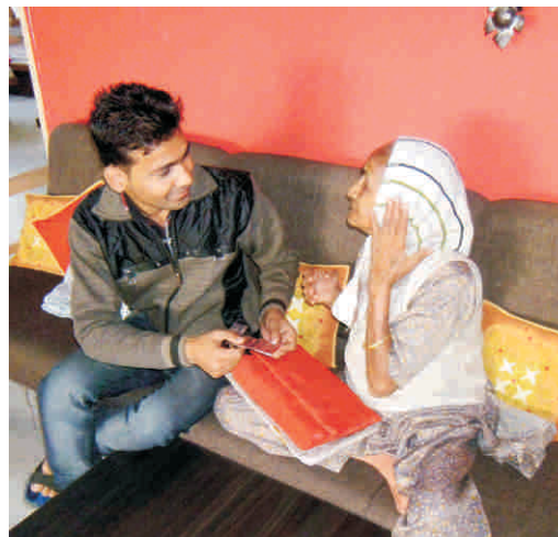
24 घंटे नर्सिंग सुविधा